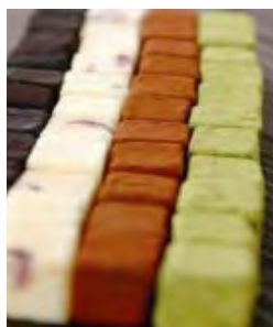
ブルージュの石畳 (生チョコ)