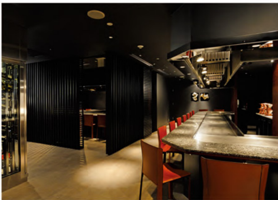
3F ร้านอาหารญี่ปุ่น ICHO 23 ที่นั่ง