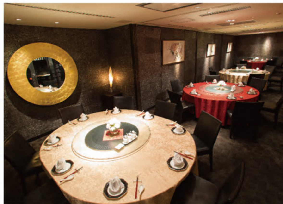
3F ร้านอาหารจีน Toh-Lee 108 ที่นั่ง