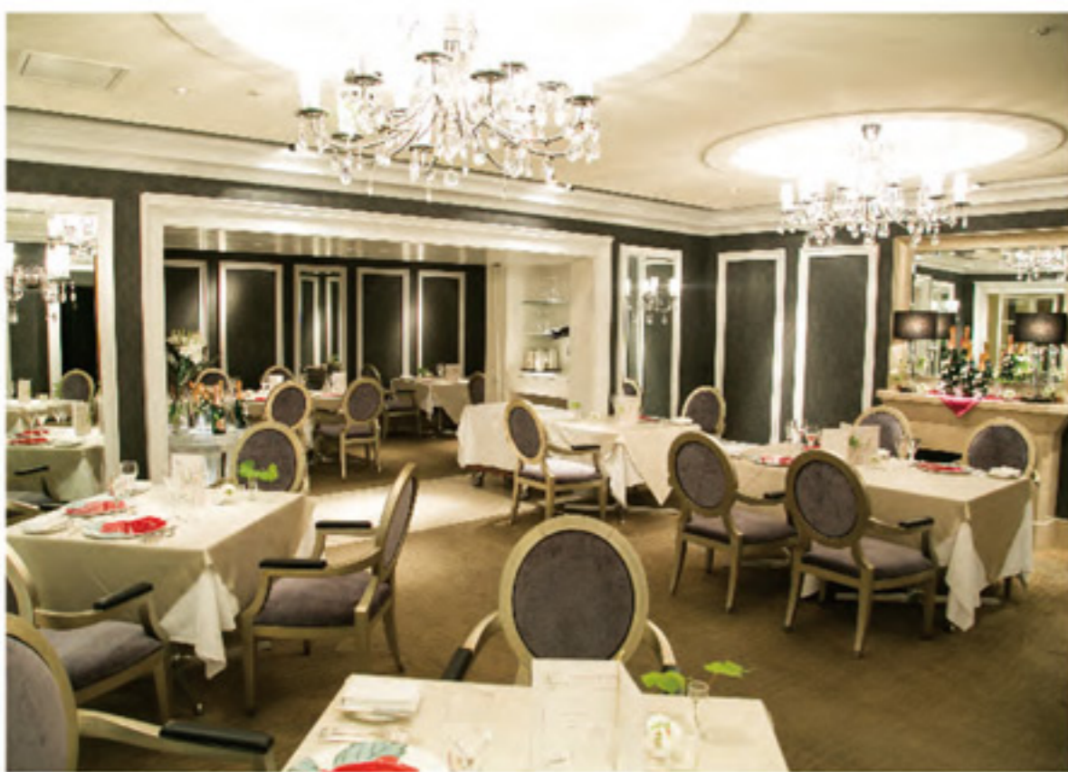
3F ร้านอาหารฝรั่งเศส Les Célébrités