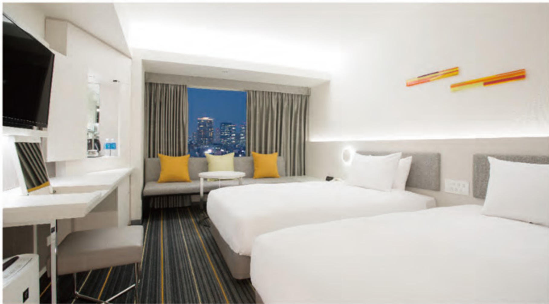
ห้องซูพีเรีย เดียงแฝด ห้องทริปเปิ้ล: ไม่มี ห้องซอลลิวูดทวิน (เตียงคู่ตัดกัน): มี ขนาดเตียง / 110~120×200cm

◆ห้องพักมีบรรยากาศแบบเมืองยุคใหม่ เข้ากับไลฟ์สไตล์ ชั้นเลิศได้อย่างลงตัวที่สุด