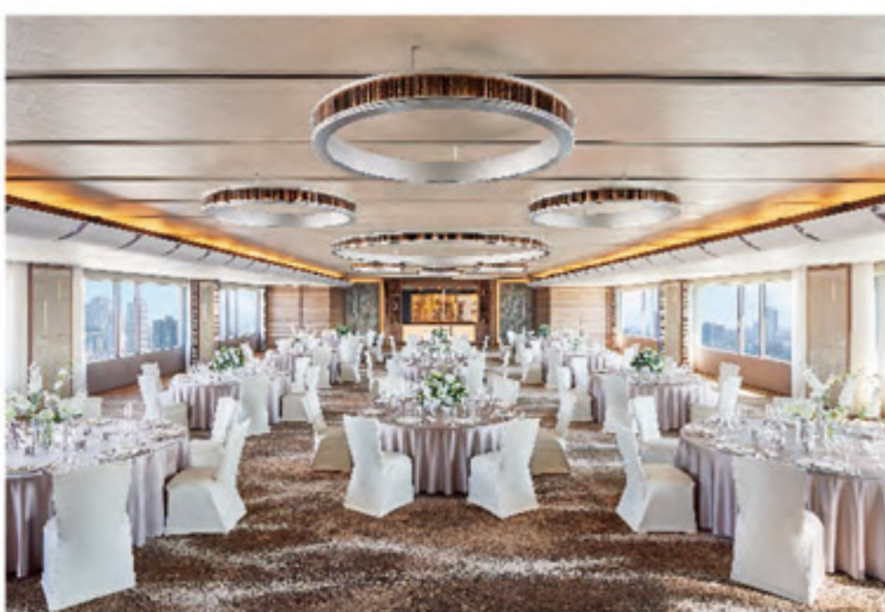
32F Sky Terrace

ห้องจัดงานเลี้ยง "Sky Terrace" ซึ่งอยู่สูงจากพื้นดิน 100 เมตร สามารถมองเห็นวิวเมืองได้ ทิว และห้องจัดงานเลี้ยง "Fontana" ที่มีดีไซน์เป็นเอกลักษณ์ พร้อมลิโอบบี้ ส่วนตัว คือ 2 ห้องจากในบรรดาห้องจัดงานเลี้ยงของโรงแรมเรา เรามีห้องจัดเลี้ยงหลากหลายขนาดเพื่อให้สอดคล้องกับความต้องการของลูกค้า เชิญมาใช้บริการที่ มาพร้อมกับการต้อนรับอย่างจริงใจของเรา