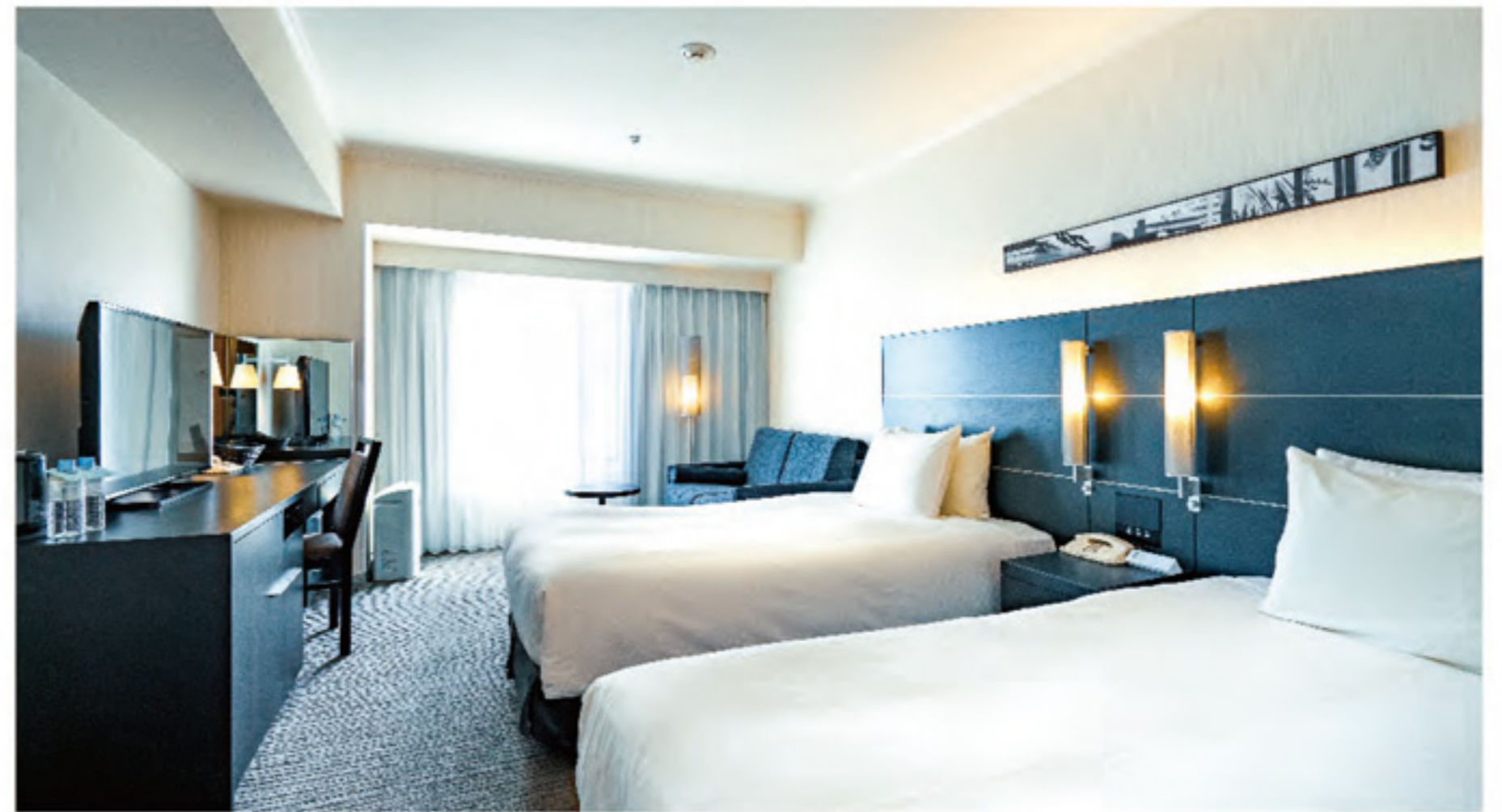
ห้องสแตนดาร์ด เดียงแฝด ห้องทริปเปิ้ล: มี ห้องซอลลิวูดทวิน (เตียงคู่ตัดกัน): ไม่มี ขนาดเตียง / 120×200cm

◆ห้องพักพร้อมประโยชน์ใช้สอยและความสะอาดสบายชั้นเลิศ ตกแต่งในโทนสีขาวดำที่ดูเรียบง่าย