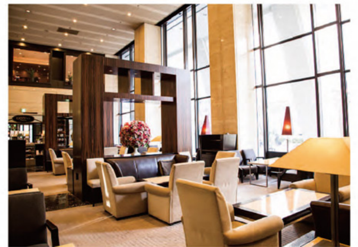
1F ที เลานจ์ Fountain 65 ที่นั่ง