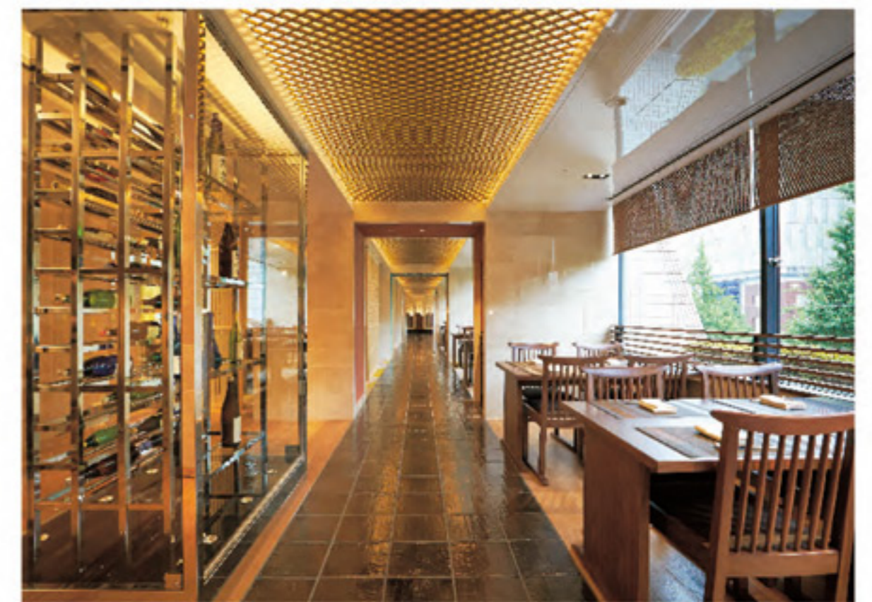
3F ร้านอาหารญี่ปุ่น Benkay 98 ที่นั่ง