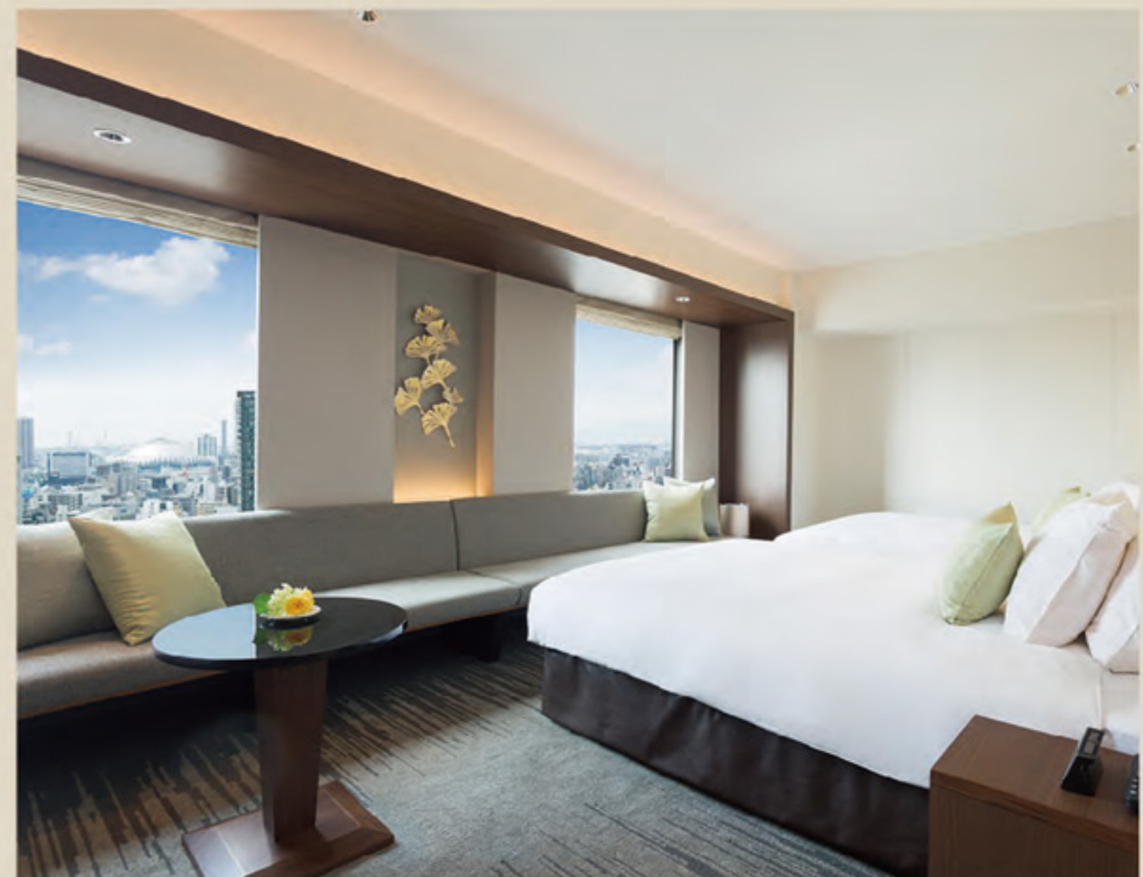
ห้องนิโก้พรีเมียมทวิน 42~47㎡ ขนาดเตียง / 140×200cm

ห้องทริปเปิ้ล: มี ห้องซอลลิวูดทวิน (เตียงคู่ตัดกัน): มี