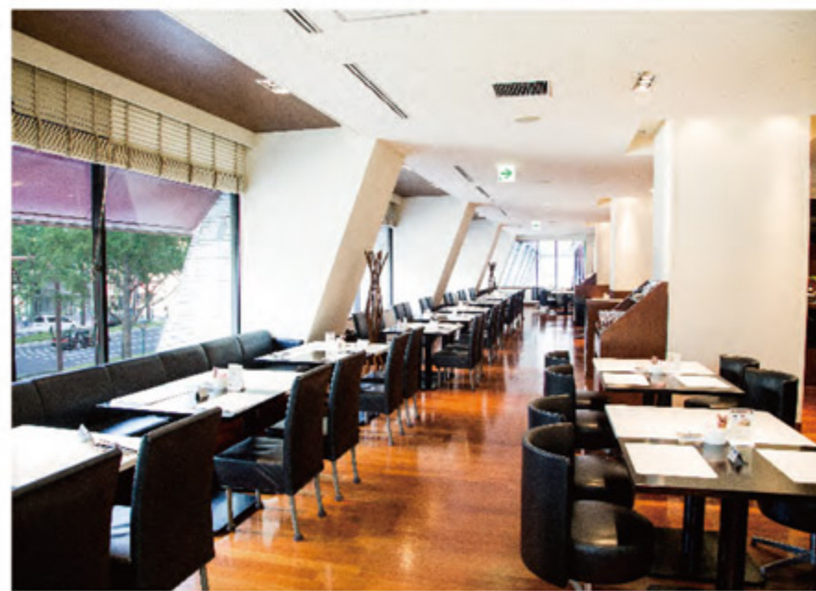
2F ร้านอาหารคาเฟ่ SERENA